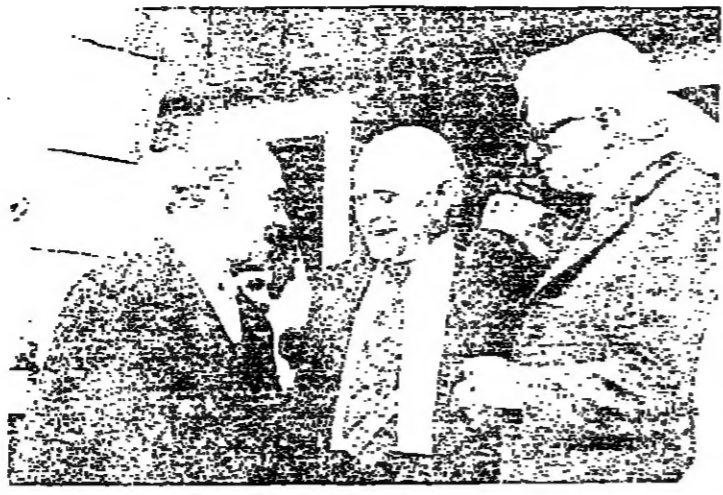
حديث ضاحك بين الوزير بطرس والقائم الخليل بمراتبة الرئيس شمعون